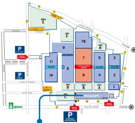
Centro Congressi PALAEXPO - Entrata A2